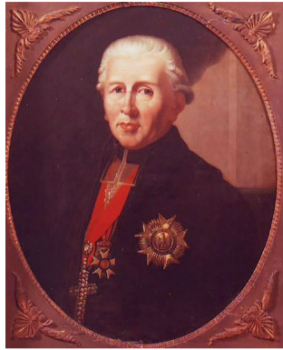
• Karl Theodor

Vanaf mei komen er steeds meer bloemen tevoorschijn. Zelfs in versteende wijken als Sint Marten is er van alles te ontdekken.